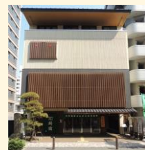
東海道かわさき宿交流館