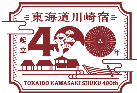
東海道川崎宿起立400年記念ロゴ

「東海道川崎宿」は、2023年に起立400年を迎えます。川崎宿は江戸幕府によって整備された五街道の内の一つである東海道に設置された宿駅。1623年に東海道の宿駅の中では最後の時期に新設され、いくつもの浮世絵や俳句の題材となっています。今でも川崎の街には「東海道」として数多くの史跡が残っています。