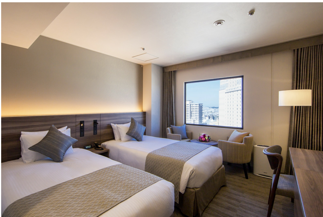
スタイリッシュツインルーム

・ツインルーム お一人様14,300円～（1室2名様利用） ※1泊室料、朝食、切子体験、サービス料、消費税含む