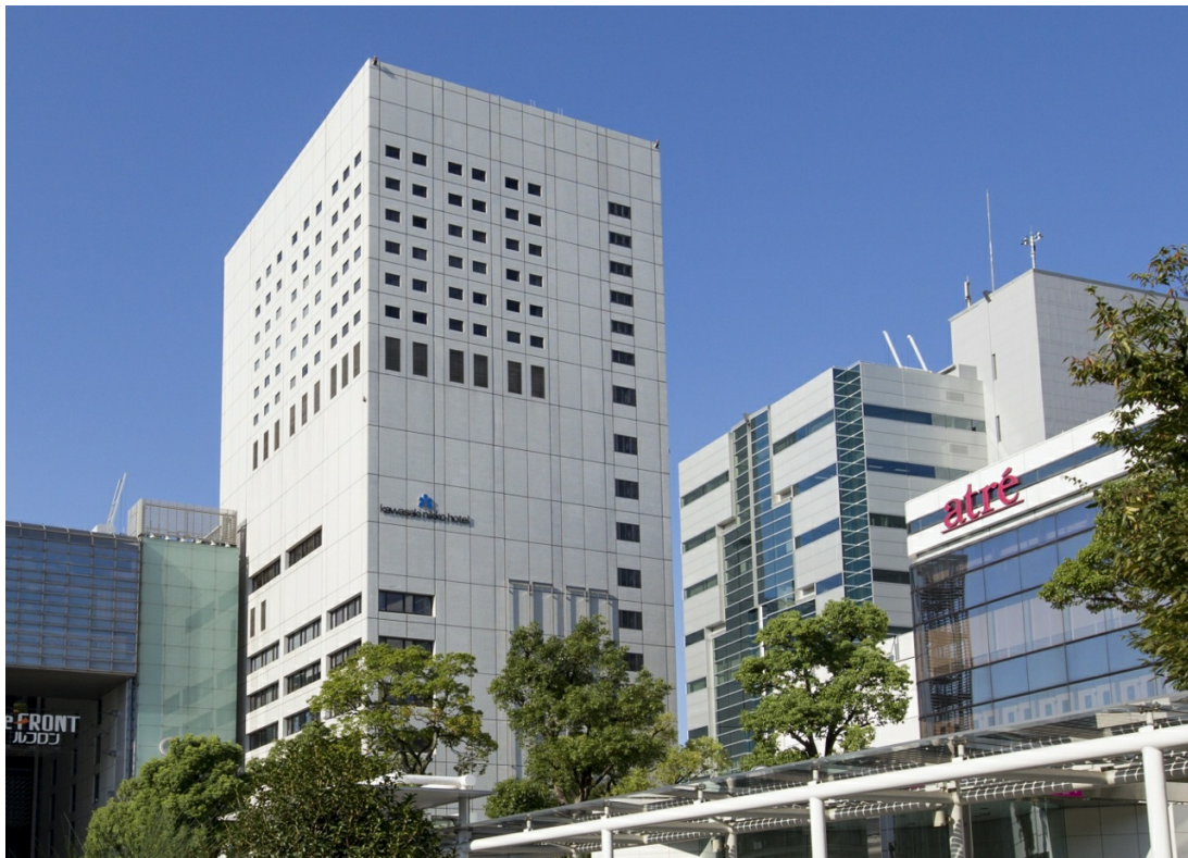
川崎日航ホテル外観