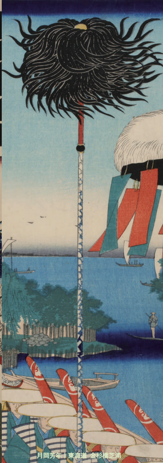
月岡芳年 | 東海道 金杉橋芝浦