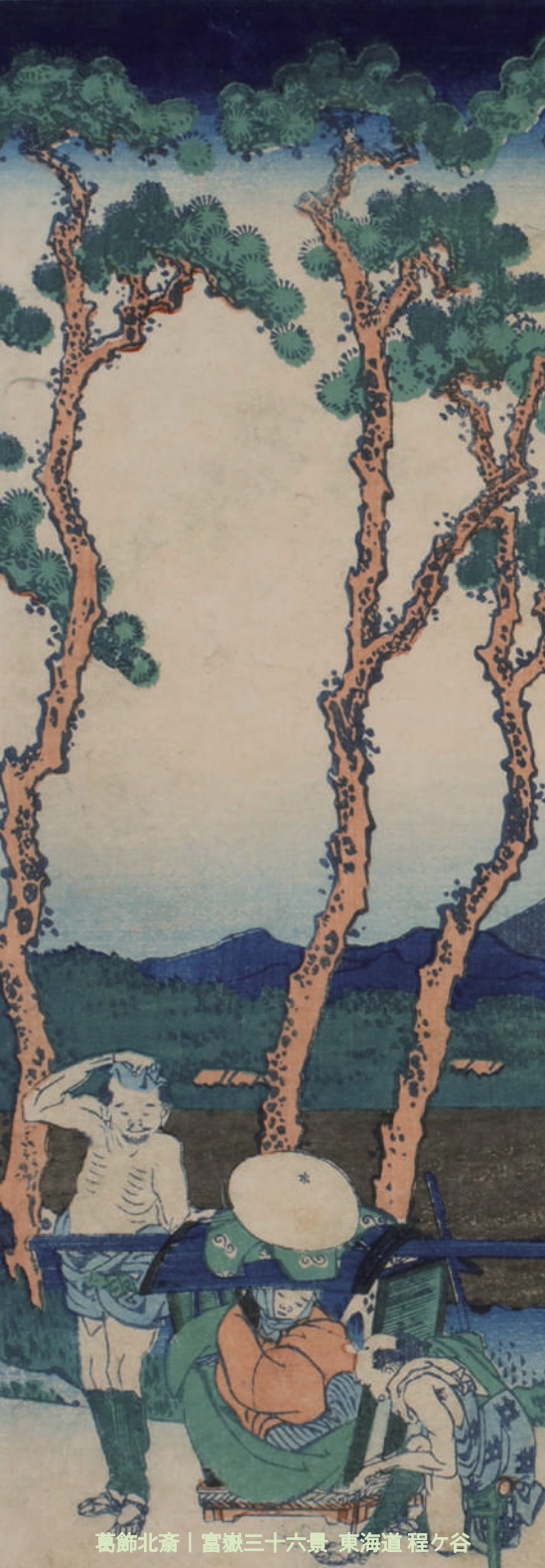
葛飾北斎 | 富嶽三十六景 東海道 程ヶ谷