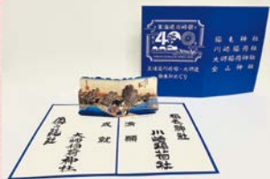
▲限定御朱印台紙イメージ

川崎宿にゆかりのある4つの神社を巡り、専用の台紙(限定1,000枚。各日予定枚数に達し次第終了)に限定の御朱印を集めましょう! 全ての御朱印を集めた人には記念のお守りを授与します。