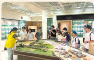
▲記念すべき年に東海道かわさき宿交流館の展示もリニューアルしました。