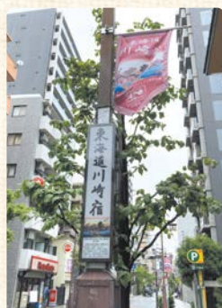
◀中間灯設置イメージ

10月から東海道沿いの街灯に行灯のような照明(中間灯)が設置され、夜の雰囲気ぐっと変わります。