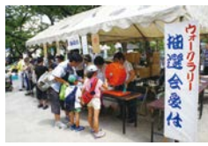
▲過去の開催の様子

大師地区の名所・旧跡を歩いて巡ります。各チェックポイントのスタンプを10個以上集めると1回、15個以上だと2回、若宮八幡宮での抽選会に参加でき、賞品(数量限定)が当たります。